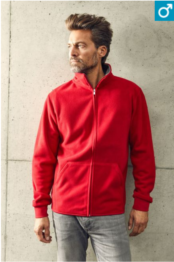
40.7971 | Promodoro 7971 Herren Double Fleece Jacke